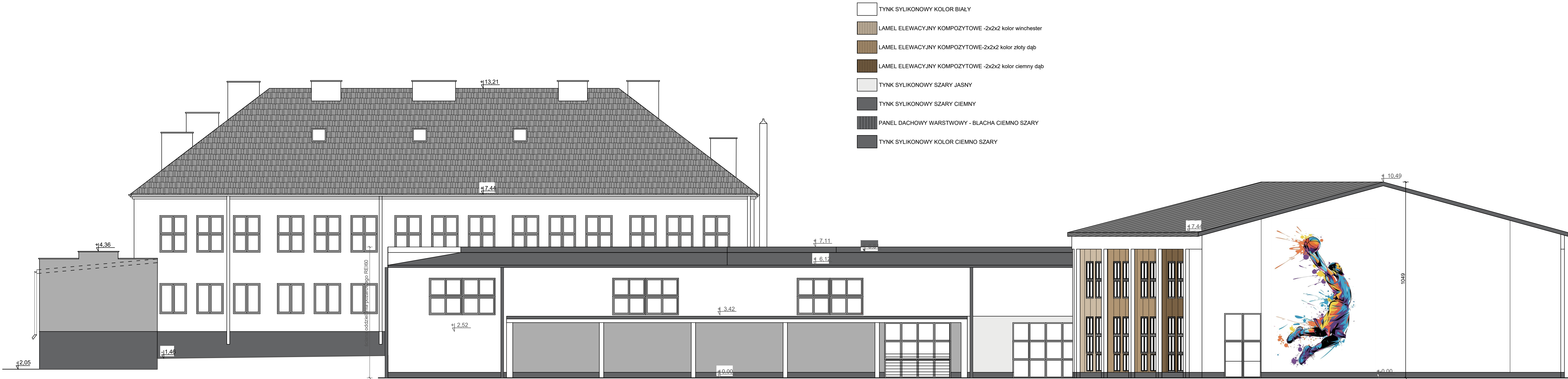
ELEWACJA POŁUDNIOWA SKALA 1:100